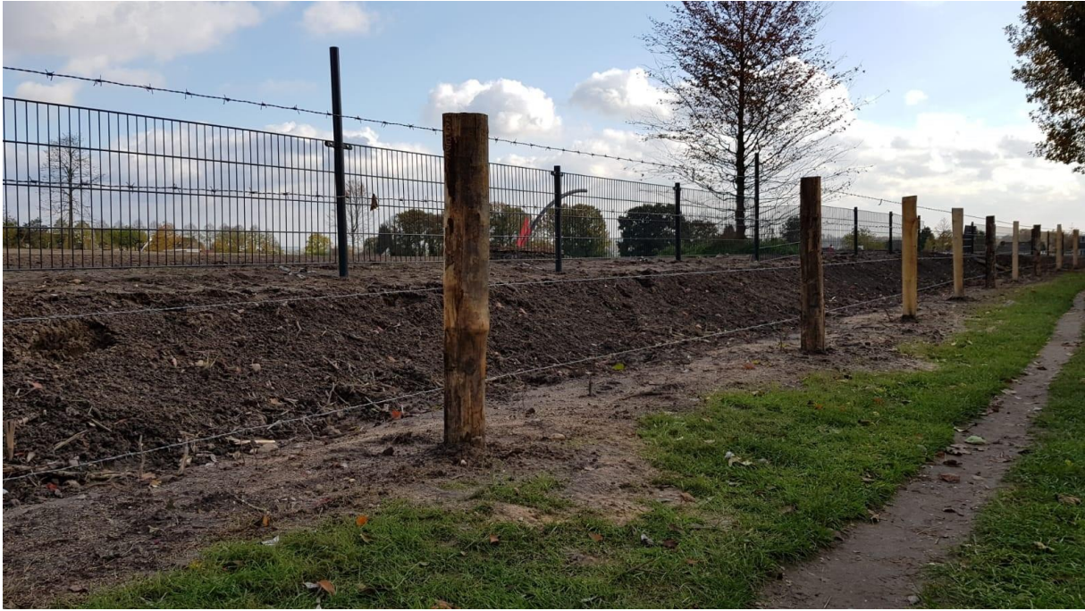
Figuur 17. Zaterdag 9 oktober: hekwerk bovenop de wal langs Ploegepad.