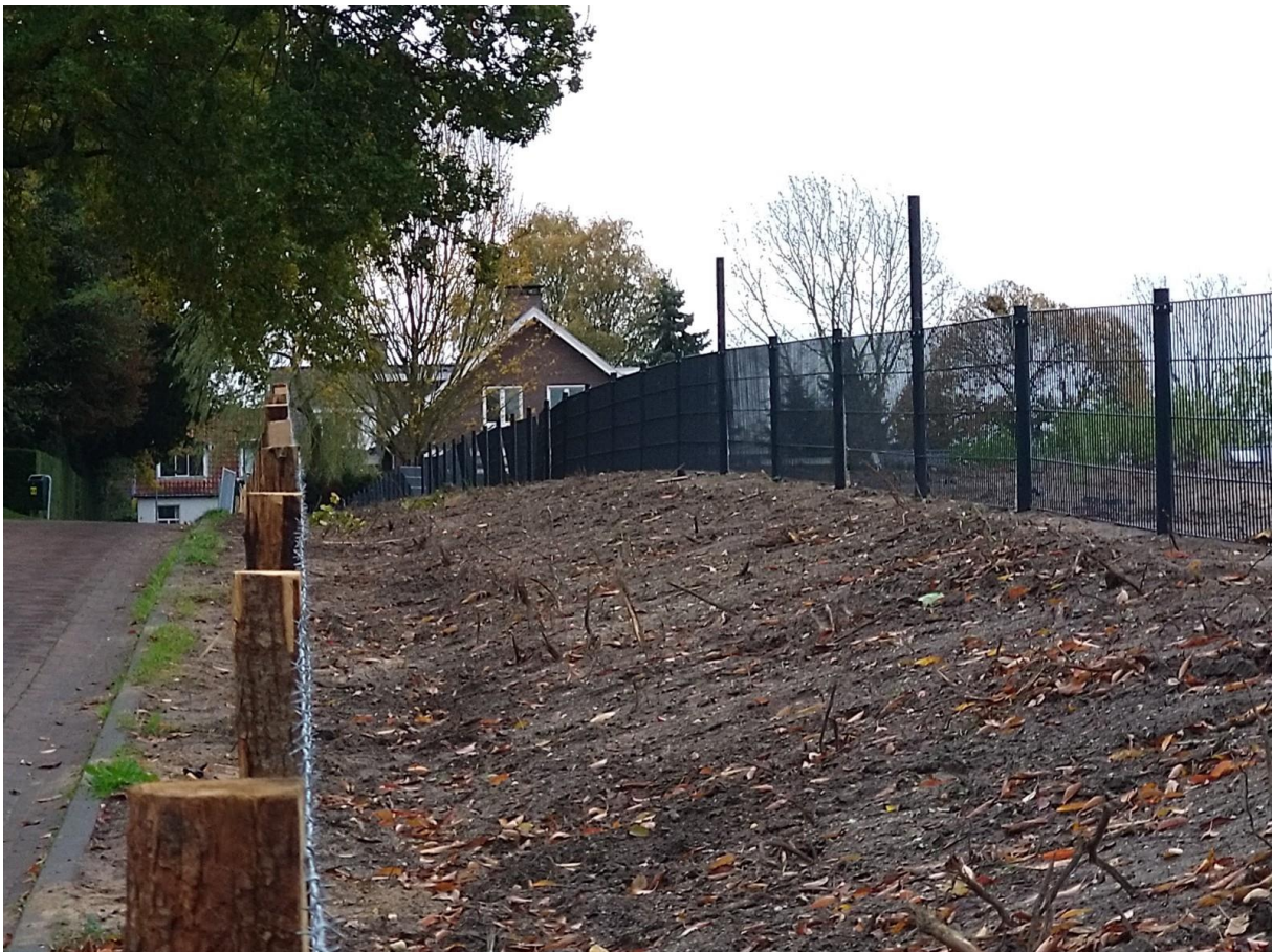
Figuur 20. Maandag 11 oktober: hekwerk langs Geelkerkenkamp bovenop de wal.