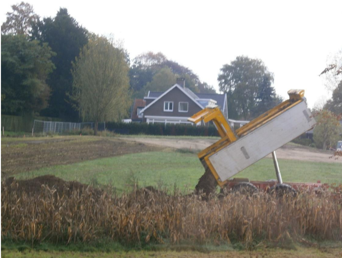
Figuur 13. Grond wordt gestort langs de perceelsranden. Bij het huis stijgt het maaiveld aanzienlijk: dat is de ophoping met 1-2 m grond die in het onderschrift bij Figuur 11 was gemeld.