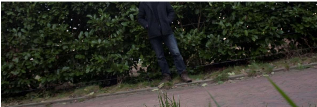
Figuur 7. Geelkerkenkamp in 2015: de akker zie je onder de haag doorschemeren.