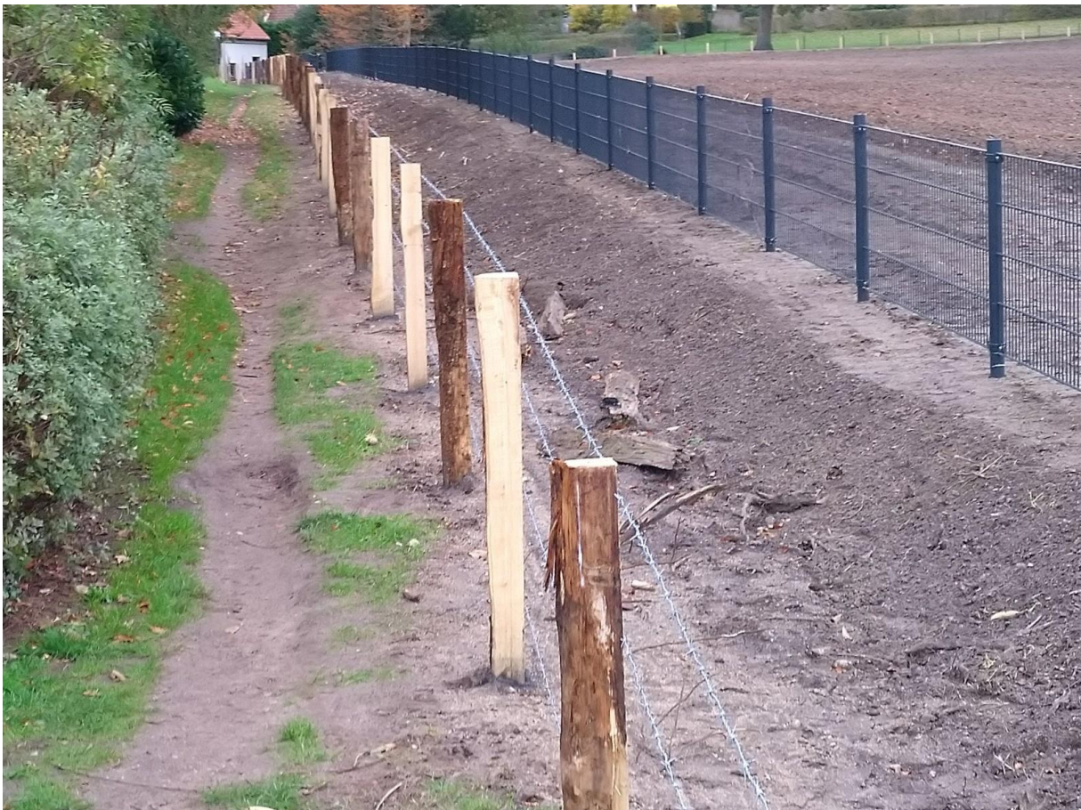
Figuur 18. Maandag 11 oktober: hekwerk langs Geelkerkenkamp bovenop de wal.