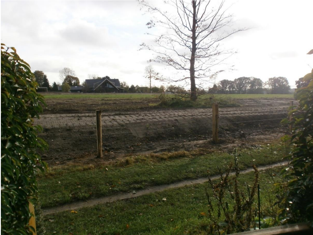
Figuur 15. De 'vermeende' wal langs het Ploegepad na aanpassing op last van de gemeente: nog steeds een wal. Afdruk van rupsbanden duidelijk zichtbaar.