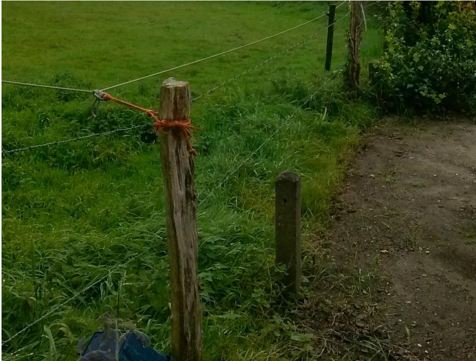
Figuur 4. Achter de zuidelijkste huizen langs de Ploegse weg in 2014: op gelijke hoogte met akker.