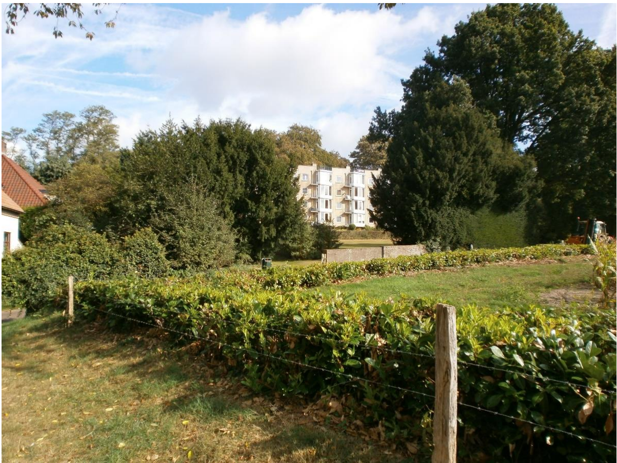
Figuur 5. Alleen aan uiterste noordzijde duikt het Ploegsepadij in 2016 naar beneden weg.