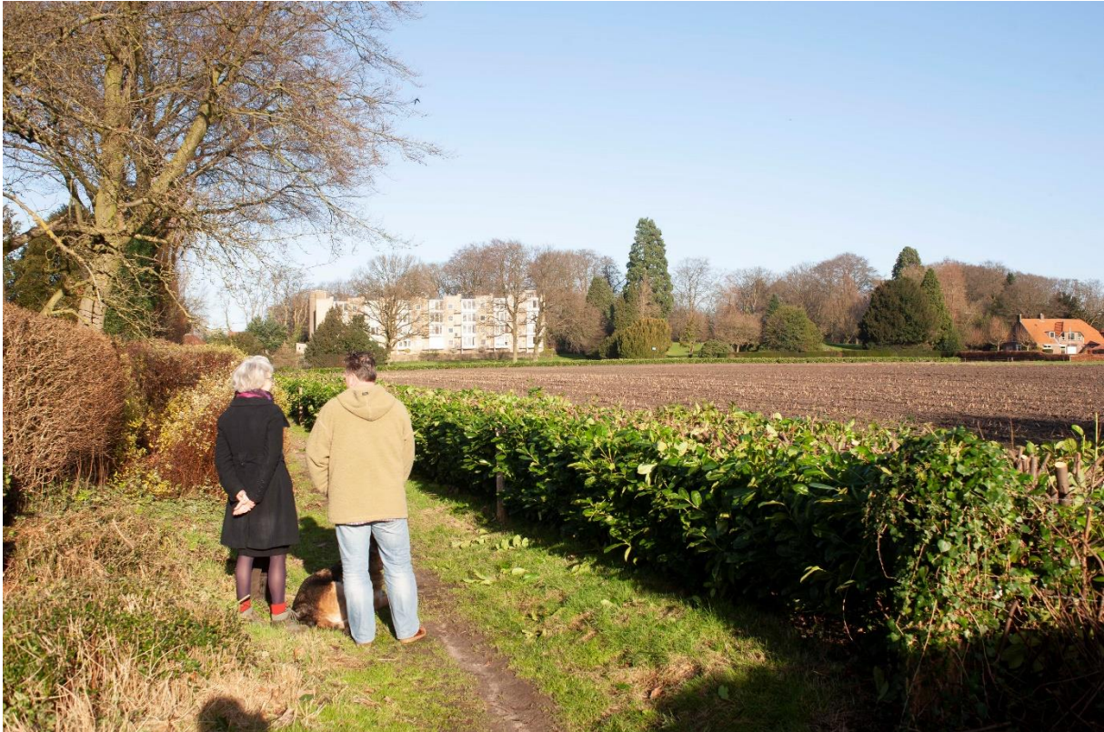
Figuur 9. Op 8 januari 2016 is de haag eindelijk, na aandringen van Vijf dorpen, gesnoeid en kunnen mensen op het Ploegepad genieten van het uitzicht.