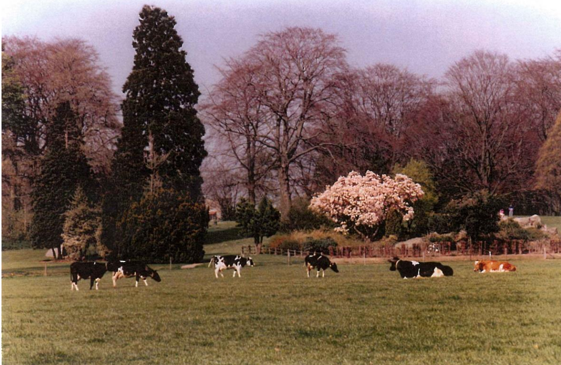
Figuur 1. Historische foto's van zowel weiland als akkerland, ook vroeger. Het landschap was toen open; heel treurig dat door telkens weer over een grens te gaan, de boel naar de vernieling wordt geholpen. En de bedoeling van de gemeente was zo mooi toen het plan voor Bato's wijk in 2006 verscheen: het park wijk zou open worden gegooid, zichtlijnen zouden worden hersteld.