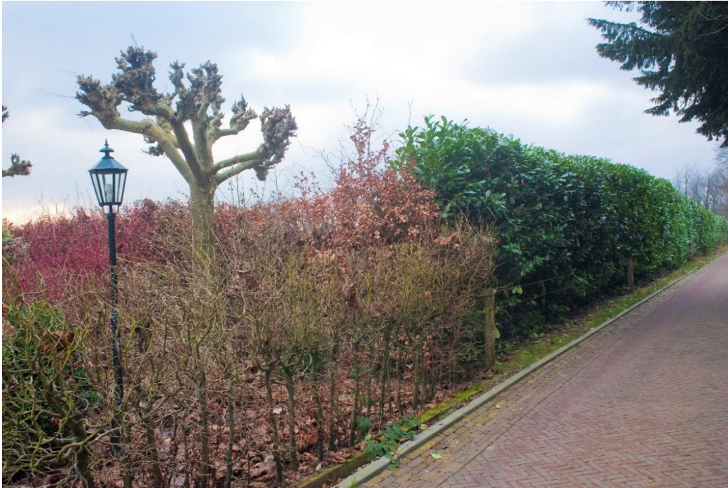
Figuur 6. Geelkerkenkamp in 2013: weg ligt misschien ietsjes lager dan akker, maar van een wal is beslist geen sprake.