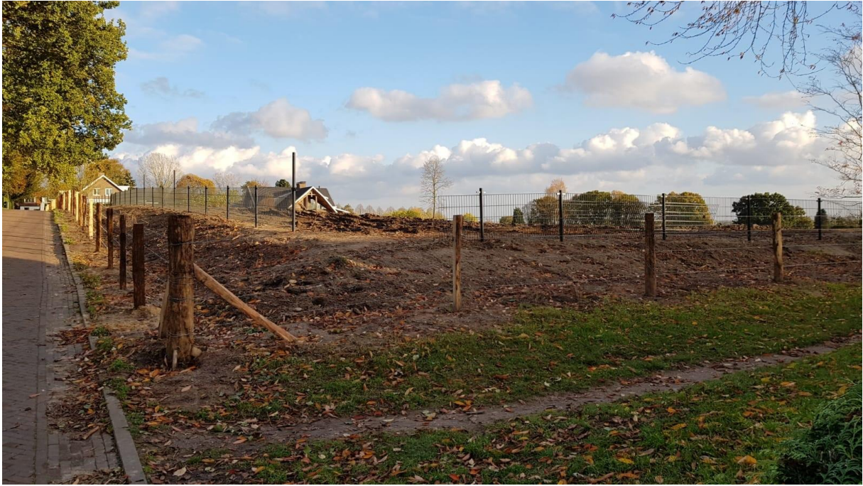
Figuur 19. Zaterdag 9 oktober: hekwerk bovenop de wal, hoek Geelkerkenkamp-Ploegsepad.