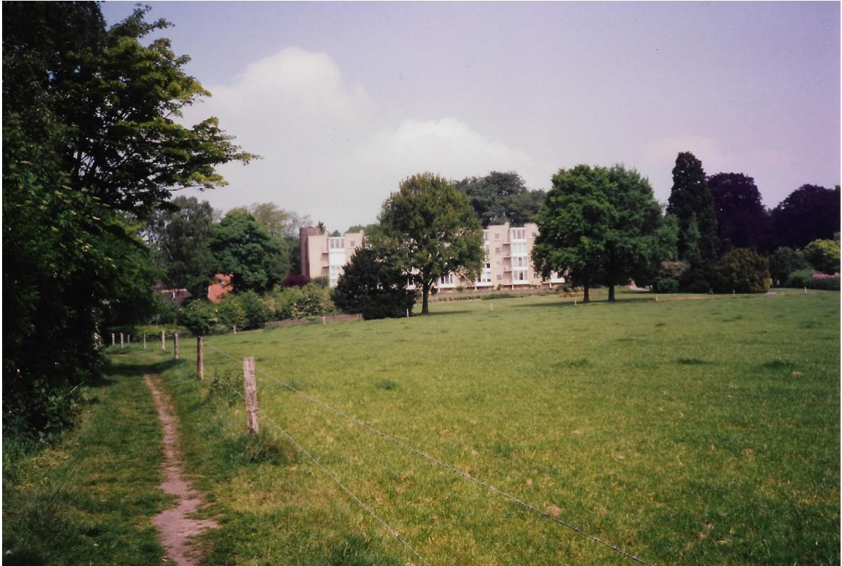
Figuur 2. Ploegsepap in 1991 op gelijke hoogte met akker.