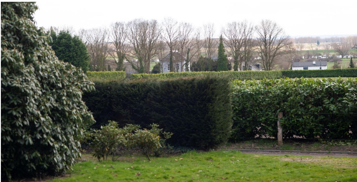
Figuur 8. Vanuit Bato's wijk richting Geelkerkenkamp in 2015: de akker zie je onder de haag doorschemeren.