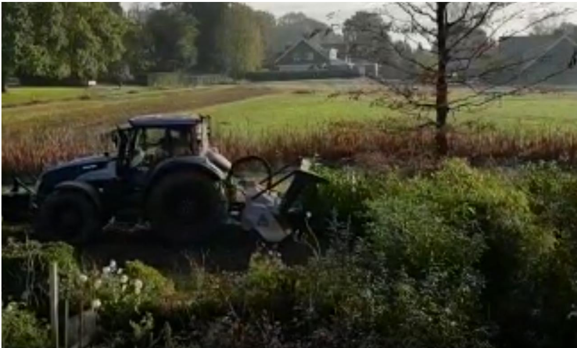
Figuur 12. Machine werkt struiken op 28 oktober 2019 volledig de grond in. Dit proces is op video vastgelegd.