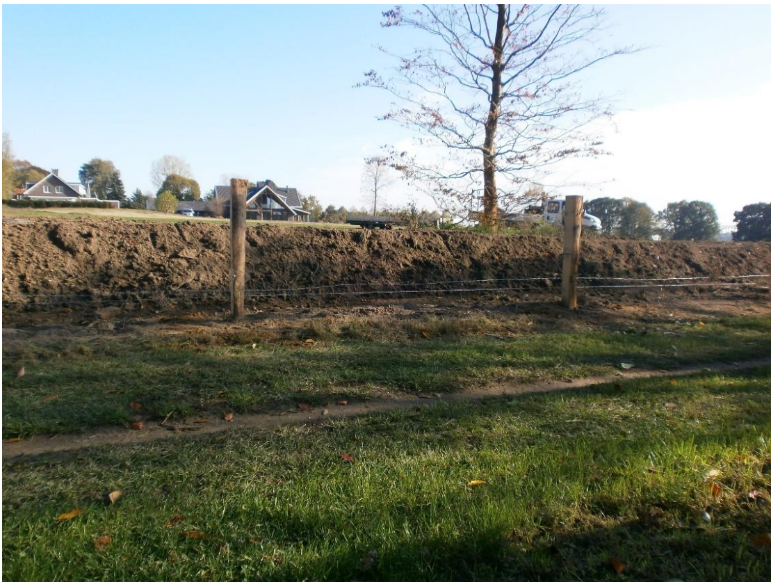
Figuur 14. De 'vermeende' wal langs het Ploegepad, net voor de melding van Vijf dorpen.