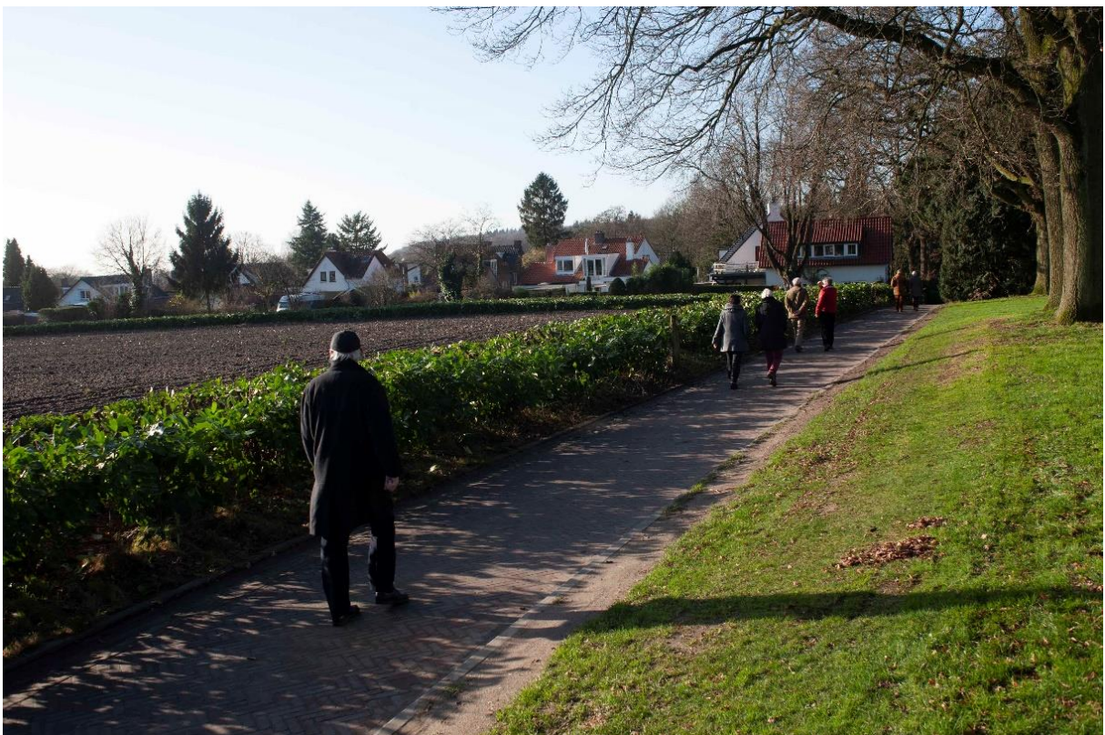
Figuur 10. Op 8 januari 2016 is de haag eindelijk, na aandringen van Vijf dorpen, gesnoeid en kunnen mensen op de Geelkerkenkamp genieten van het uitzicht.