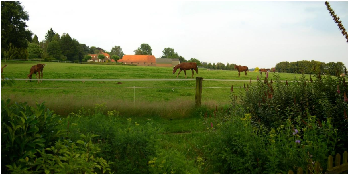
Figuur 3. Het perceel in 2014, vlakbij de hoek met de Geelkerkenkamp waar het Ploegsepap iets naar beneden duikt. Een bolle es, niet omgeven door een wal.