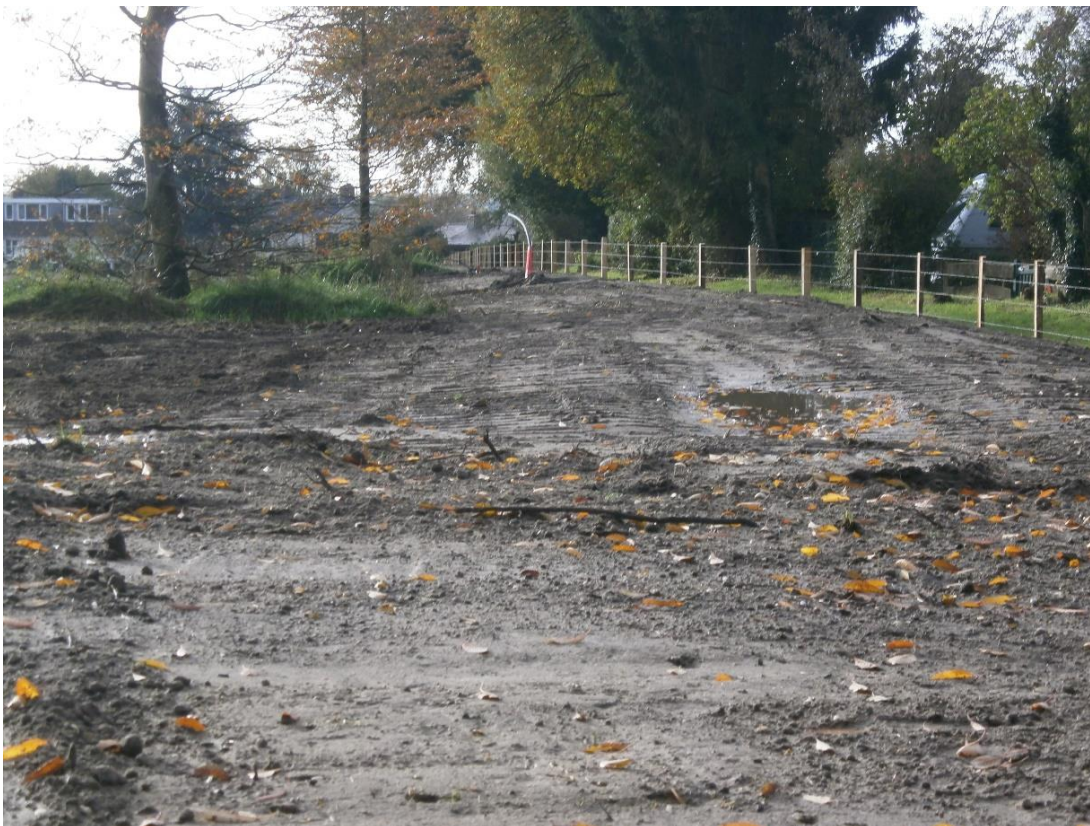
Figuur 16. Resultaat: een hol perceel, aan de randen het hoogst, waar het perceel vroeger bol was.