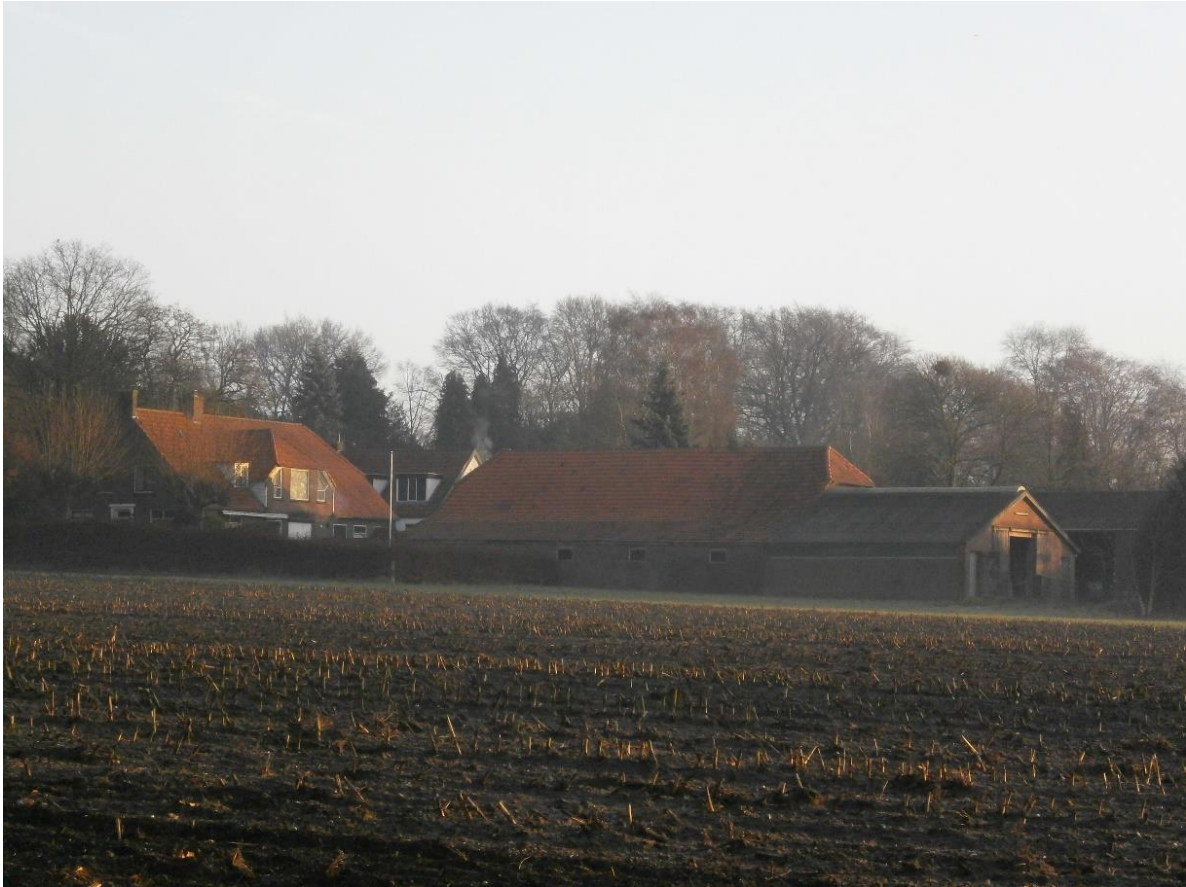
Figuur 11. De inmiddels afgebroken boerderij in 2016. Het maaiveld is recent ter plaatse met 1-2 m opgehoogd.