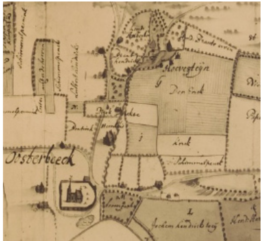
De agrarische nederzetting Oosterbeek uit 1660: bewoning bij het oude kerkje en aan het Zweiersdal; vele akkers ('enken') daaromheen, waarvan nu die aan de Bildersweg en Geelkerkenkamp resteren).

In cultuurhistorisch opzicht is het dal van grote betekenis. Oosterbeek is ongeveer duizend jaar geleden ontstaan als agrarische nederzetting in het benedendorp. Op een landkaart uit 1660 zien we vooral bewoning in het Zweiersdal en rond het oude kerkje. De Zuiderbeek, die vanaf de Dam door het Zweiersdal stroomt, is de meest oostelijke beek in het dorp; vandaar vermoedelijk de naam 'Oosterbeek'. Door de vroege invloed van de mens op het dal, is de 'archeologische verwachtingswaarde' van de ondergrond hoog: bij graven in de bodem is de kans groot dat je op de menselijke geschiedenis stuit.