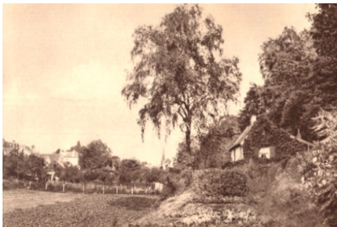
Paginavullende foto van 1915 uit het jubileumboek van de 'Maatschappij tot Exploitatie van Staatsspoorwegen' waarin de mooiste plekjes van Nederland zijn vastgelegd.

velduil, ransuil, groene specht, salamanders, paarbladig goudveil, eenbloemig parelgras, en vele andere bijzondere soorten voelen zich er thuis. De waardering voor het Zweiersdal is niet iets van de laatste tijd. In bijvoorbeeld een luxe jubileumuitgave van de staatspoorwegen uit 1915 staan foto's van de mooiste plekjes van Nederland en daartoe behoort, hoe kan het ook anders, het Zweiersdal! Nu we in een wereldwijde klimaatcrisis verkeren wordt de functie van het Zweiersdal als groene long steeds belangrijker. Daken, asfalt en stenen zorgen voor zomerse hitte en voor wateroverlast bij hevige buien. Groen zorgt juist voor verkoeling, een soepele infiltratie van regenwater in de bodem en het vastleggen van CO2.